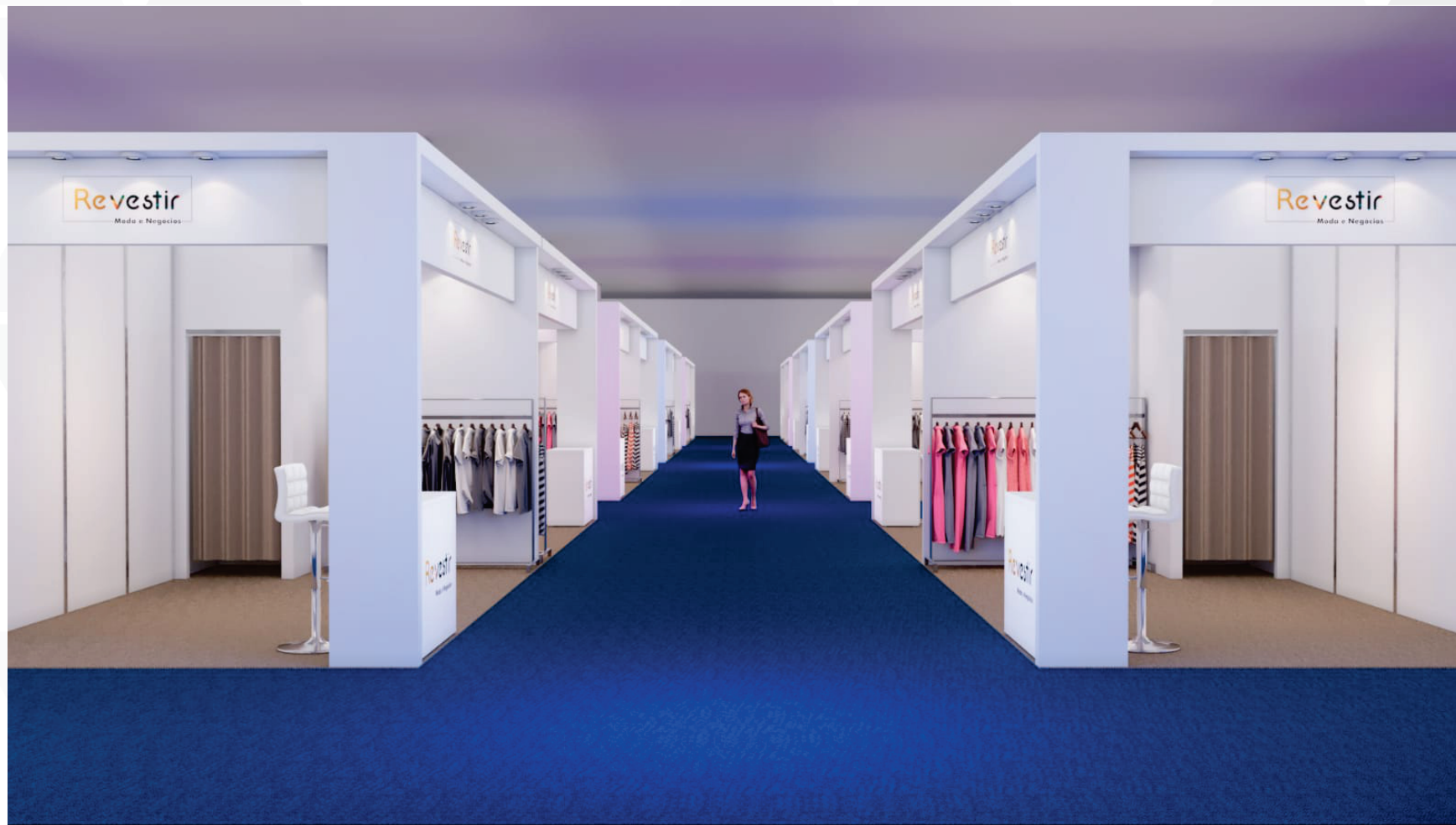
Stand 3,0X5,0 mts Duplo

Os stands foram planejados com design moderno e elegante para proporcionar maior visibilidade. Todos os stands são localizados em esquina.